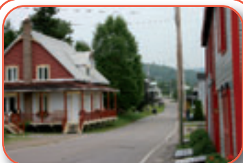
Le village de Saint-Jean propose une halte bucolique.

Jour 7 : Selon l'heure de marée, navigation jusqu'à Cap à l'Est puis retour à Tadoussac. Nous revenons vers l'embouchure du Saguenay, avec un peu de chance sous spi.