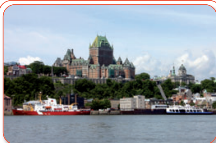
Départ de la très belle ville de Québec avant de se perdre dans les immensités naturelles.

Jour 5 : Nous quittons l'anse Saint-Jean pour une courte navigation vers la baie Éternité (1 à 2 heures). Cette profonde