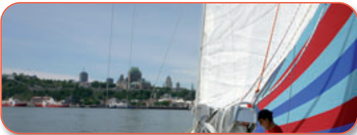
A la voile, devant Québec, au moment du départ...

La baie de l'Éternité est la plus spectaculaire du parc national.